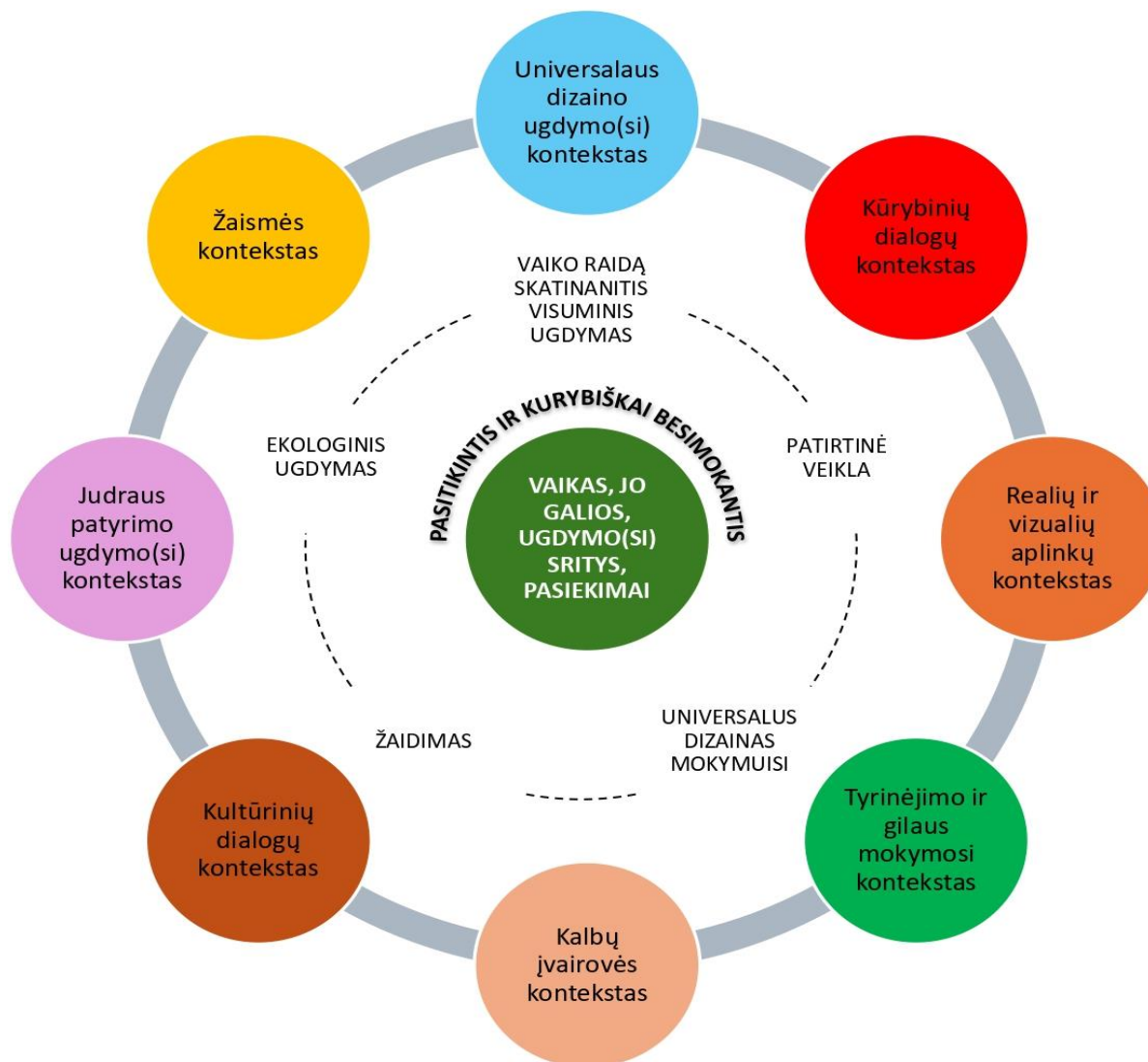
1 schema. Kauno lopšelio-darželio „Daigelis“ konceptualus ugdymosi modelis